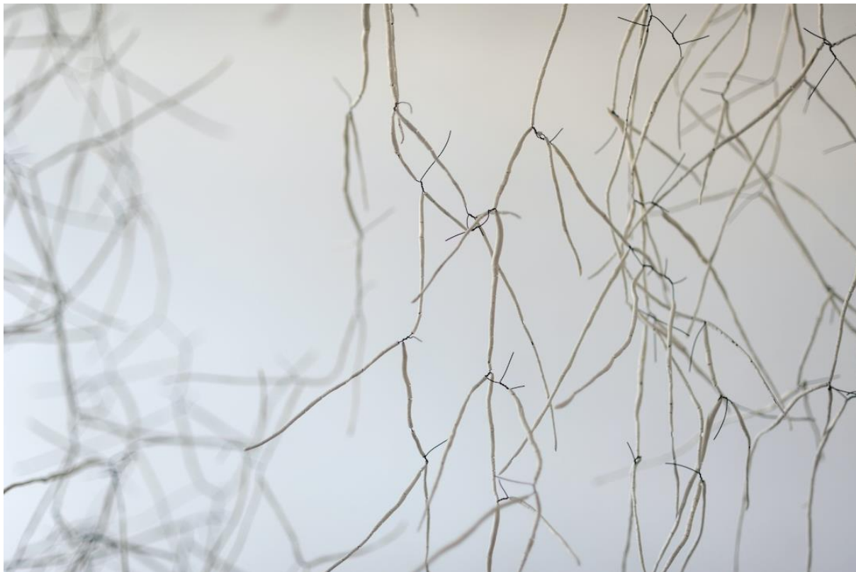
Anne Laval, Forêt d'ossements, détail d'installation (variable selon les espaces). Porcelaine et acier