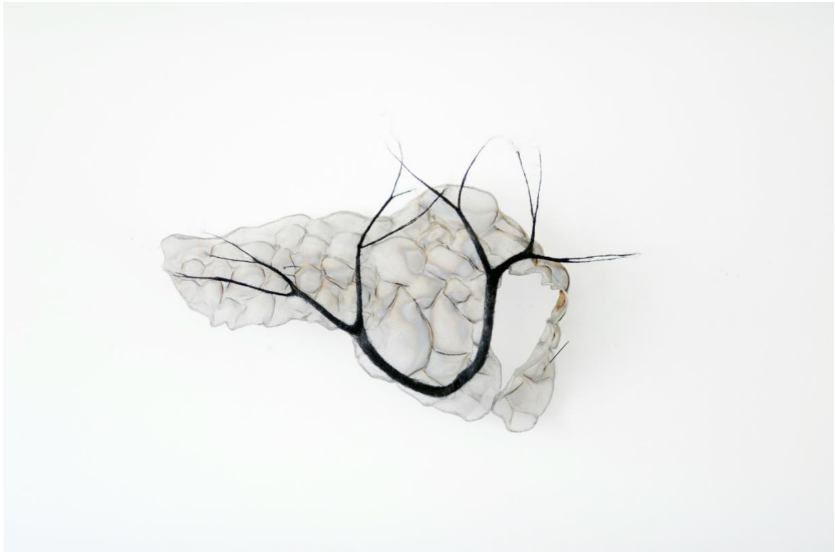
Anne Laval, Carte fantôme 3, 2022, 14x25 cm, gaze d'inox et laine d'acier sculptées